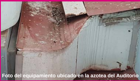
Foto del equipamiento ubicado en la azotea del Auditorio